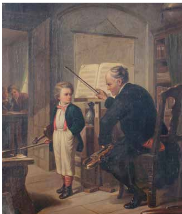
El maestro de música , s. XIX.

Hojas de parra Santiago: Ganimedes, 1985.