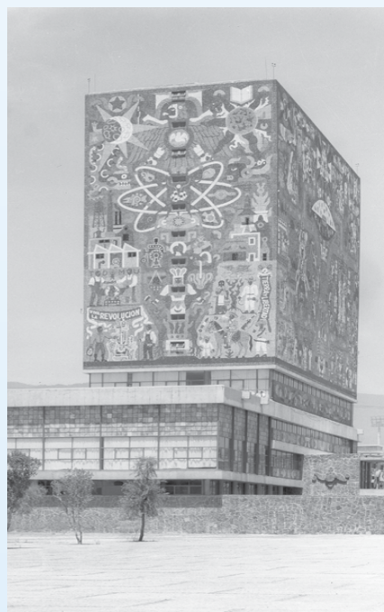
Biblioteca Central, Ciudad Universitaria.

Sylvia Schmelkes, presidenta del Instituto Nacional de Evaluación para la Educación en 2013, citado por Juan Fidel Zorrilla Alcalá en "La construcción de alternativas de formación docente para el bachillerato y para la licenciatura en México" en Perfiles educativos . Vol. 37, núm. especial (2015), p. 37.