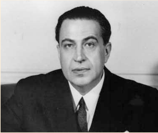
Jaime Torres Bodet.