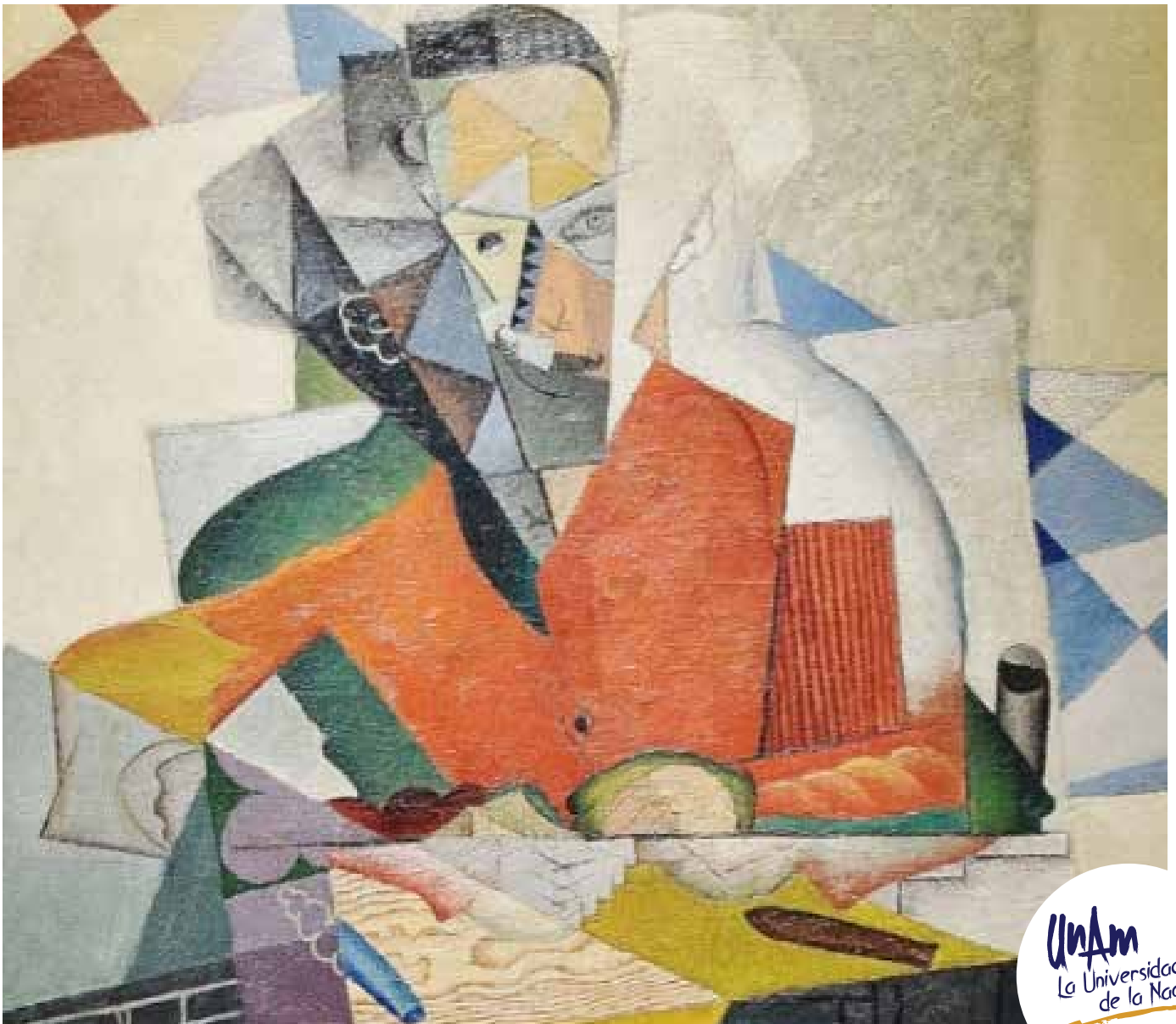
El arquitecto, Diego Rivera 1915.