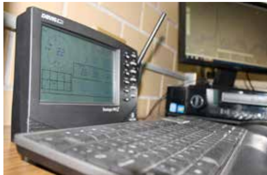
Codificador que permitirá recibir la señal a través de Internet.

Las conferencia son en tiempo real, la de la NASA también será en tiempo real, el año antepasado tuvimos tres videoconferencias, una en España y tres en Estados Unidos, finalizó el profesor. ☺