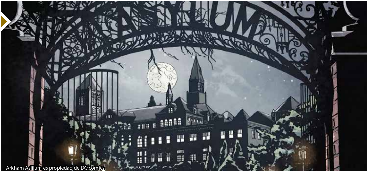
Arkham Asylum es propiedad de DC comics