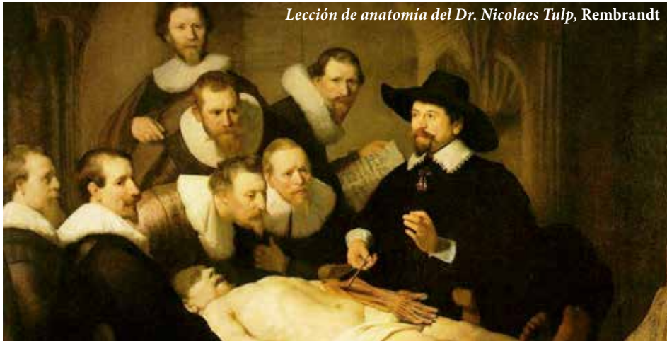
Lección de anatomía del Dr. Nicolaes Tulp, Rembrandt