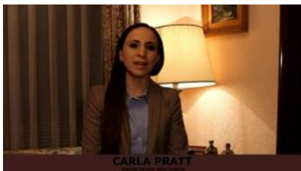
4 - Principios del Sistema Acusatorio