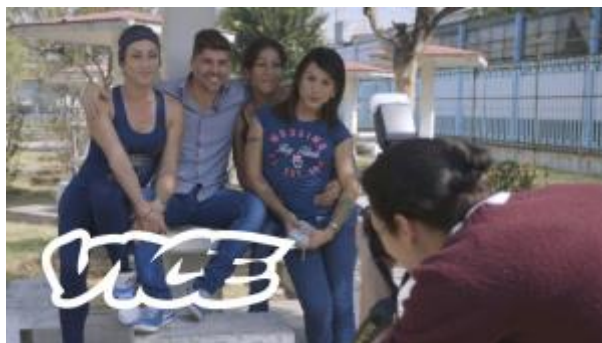
2 - Mujeres Trans en cárcel de hombres.

¿Has pensado en qué centro de reclusión estarían las mujeres trans?