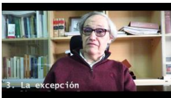
3 - Diferencia de Principio y Norma.