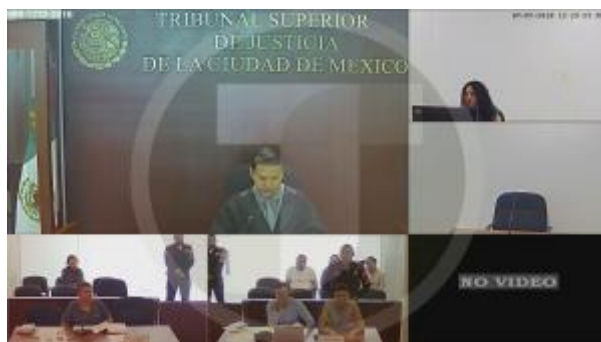
1 - Joven de 18 años acusado de narcomenudeo (consumo)

Ahora es turno de analizar una audiencia con base en el Sistema Penal Acusatorio