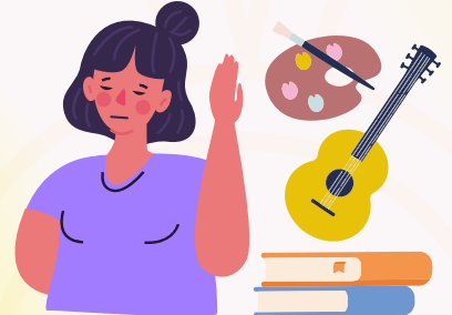
Dejan de interesarle actividades que antes disfrutaba