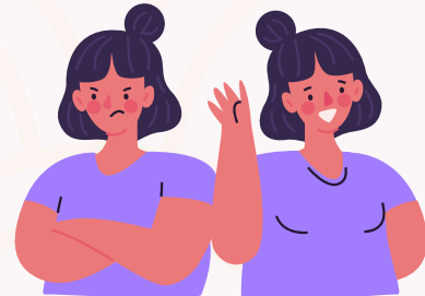
Cambios en su estado de ánimo