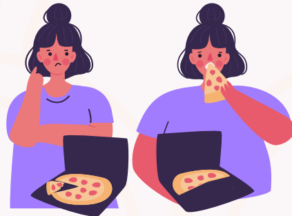
Come poco o en exceso