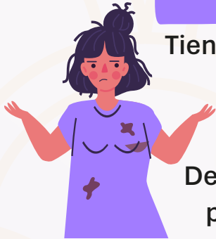
Tiene bajo rendimiento escolar